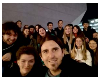
Remix 19 de fevereiro 2019 Casa da Música