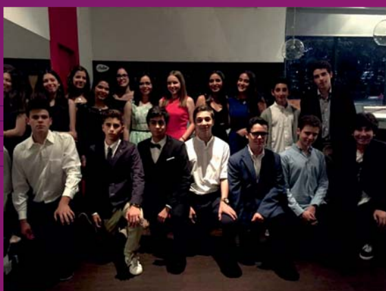
9ºano Fontes Pereira de Melo/CMSM