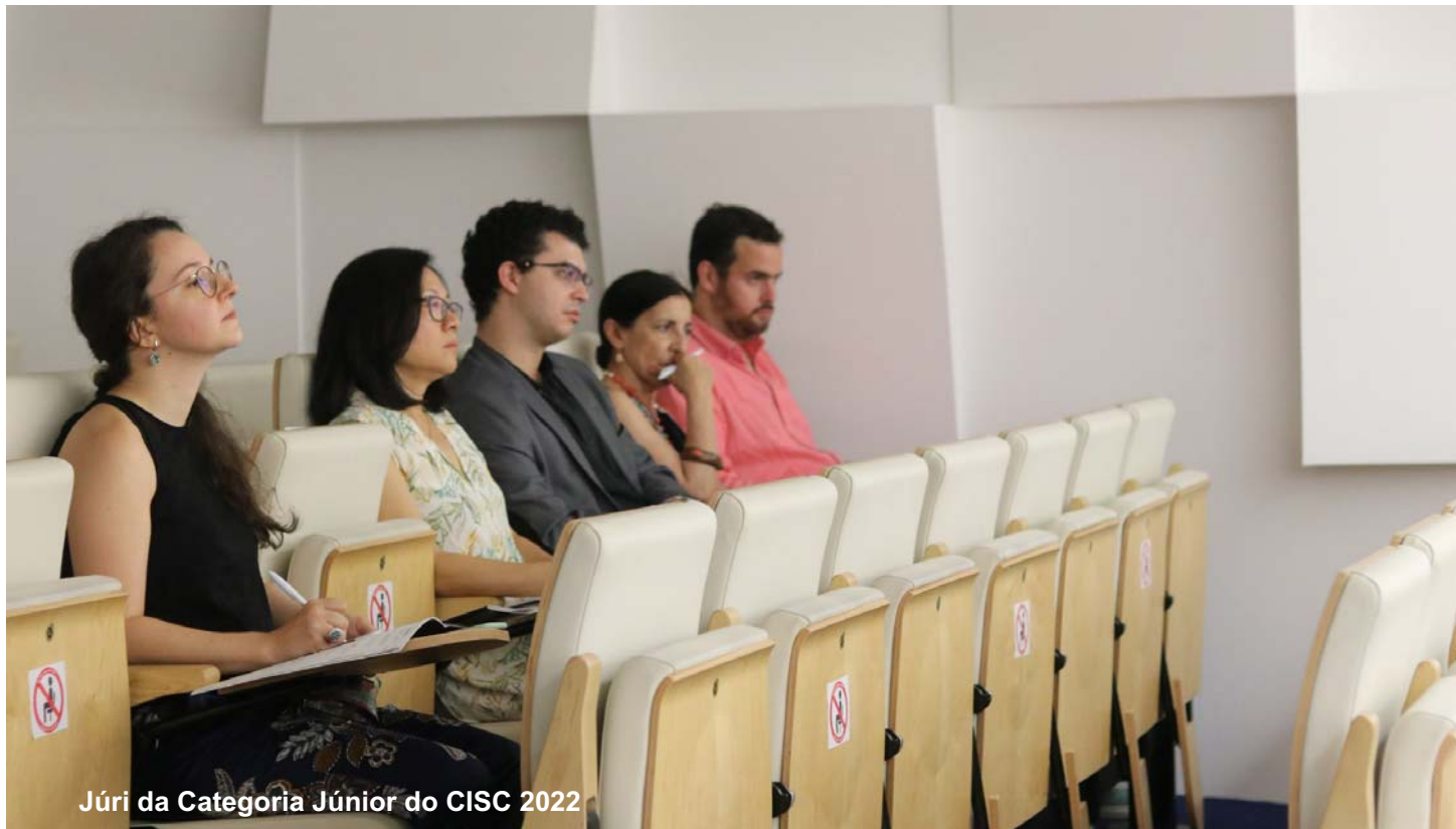
Júri da Categoria Júnior do CISC 2022