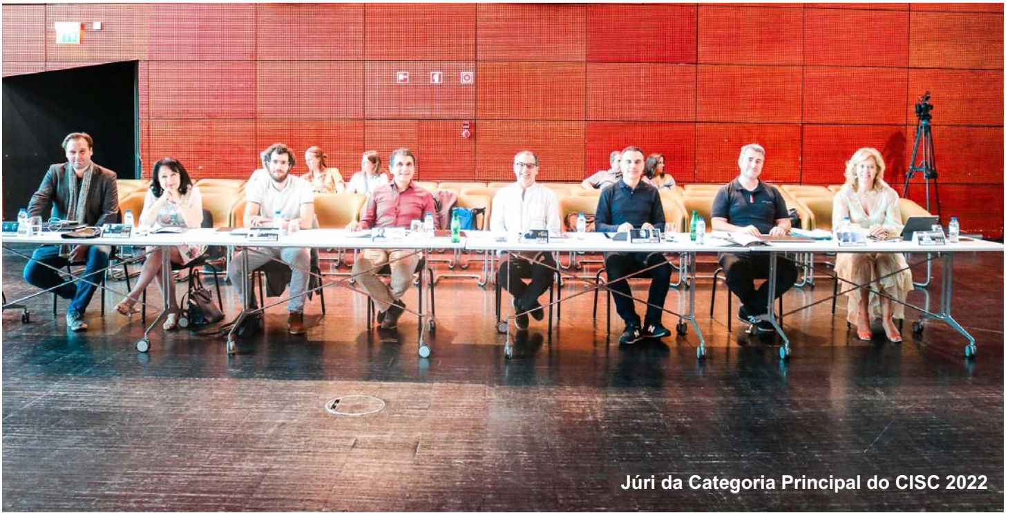
Júri da Categoria Principal do CISC 2022